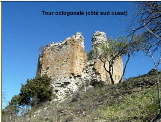
Saint Maime (04300) "Chapelle Sainte-Agathe .13eme siecle"

Le site offre un excellent panorama sur la plaine de Mane ainsi que sur le confluent de la Laye et du Lague.